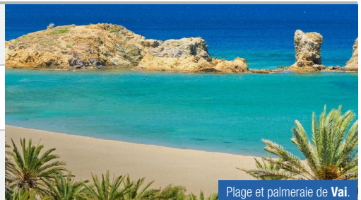
Plage et palmeraie de Vai.

www.idealoperating.fr - contact@idealoperating.fr - +33 6 24 64 35 58