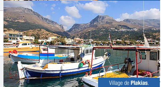
Village de Plakias.