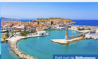
Petit port de Réthymnon.