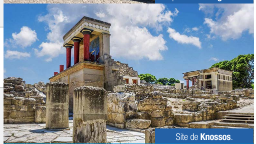
Site de Knossos.