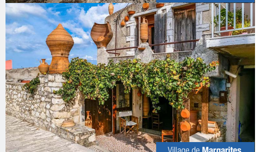
Village de Margarites.