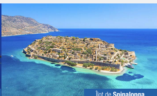
Îlot de Spinalonga.