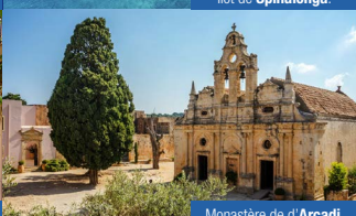
Monastère de d'Arkadi.