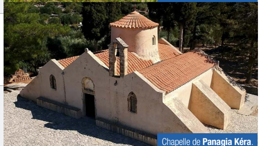
Chapelle de Panagia Kéra.