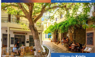
Village de Kritsa.