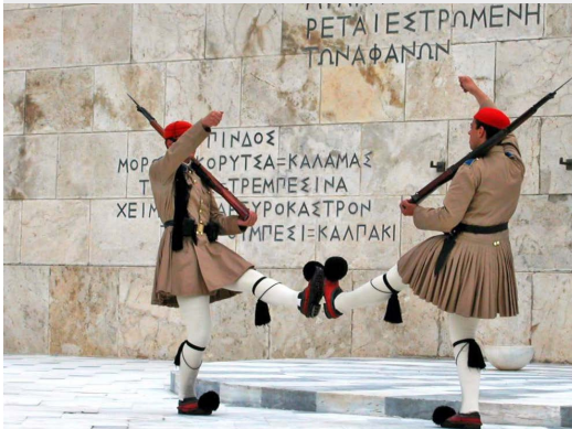
Place Syntagma - Parlement

Est l'une des plus anciennes villes au monde, avec une présence humaine attestée dès le Néolithique. Fondée vers -800 autour de la colline de l' Acropole par le héros Thésée , selon la légende. La cité domine la Grèce au cours du 1 er millénaire av. J.-C.