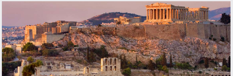
Acropole - Athènes