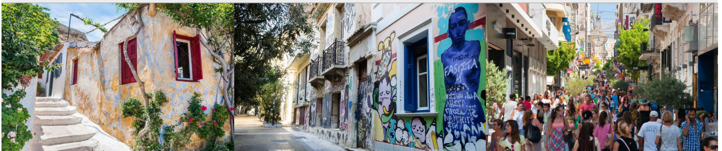
rues - Athènes

* Prix nets «à partir de» base 30 payants.