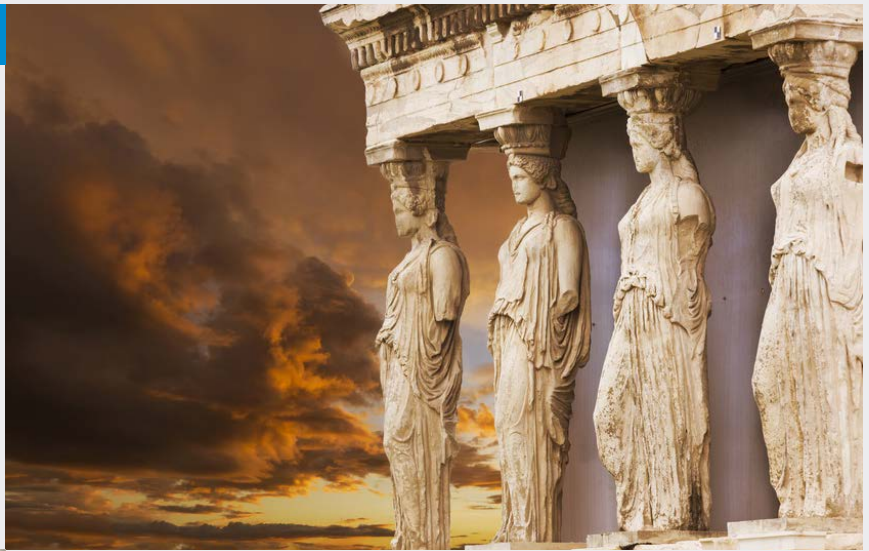
Acropole - Athènes