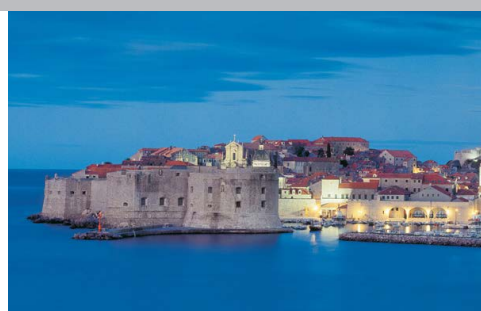
Port et Citadelle de Dubrovnik

Tout Inclus : Pension complète avec boissons, visite de Dubrovnik , une mini croisière avec apéritif en mer, dîner festif avec musiciens, guide et transferts exclusifs. Vols non compris .