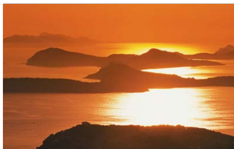
Îles Elafiti au large de Dubrovnik

Petit déjeuner à l'hôtel et temps libre. Transfert à l'aéroport. Enregistrement et départ du vol et retour vers la France.